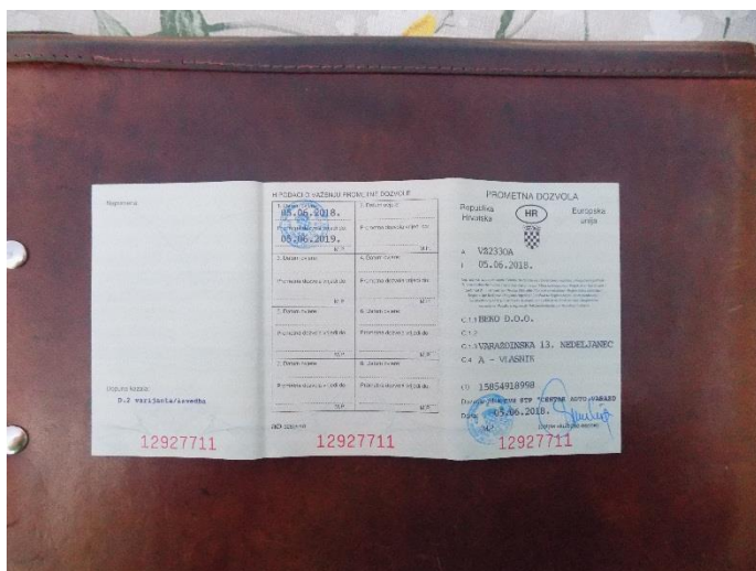
5. Mercedes ATEGO 816 – prometna dozvola