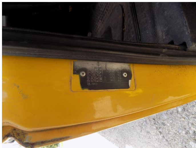
2. Volkswagen Transporter – broj šasijske