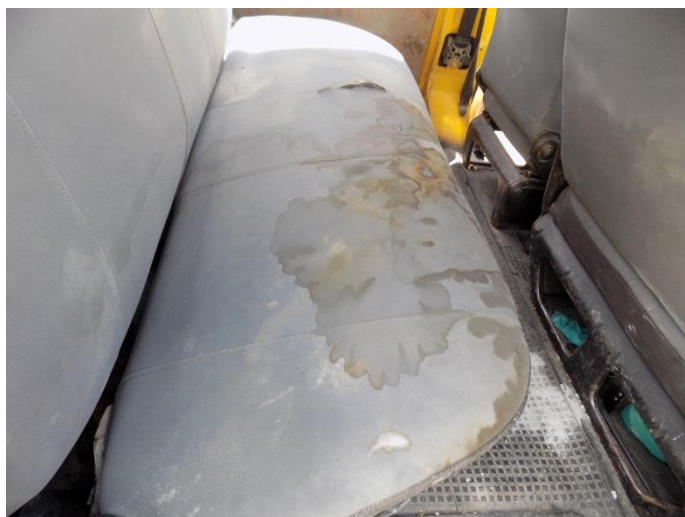
3. Volkswagen Transporter - unutrašnjost vozila