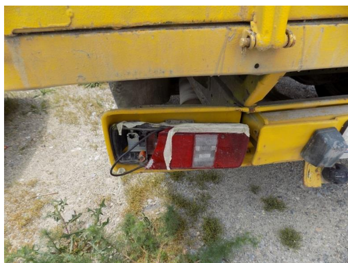
4. Volkswagen Transporter – oštećenje svjetla