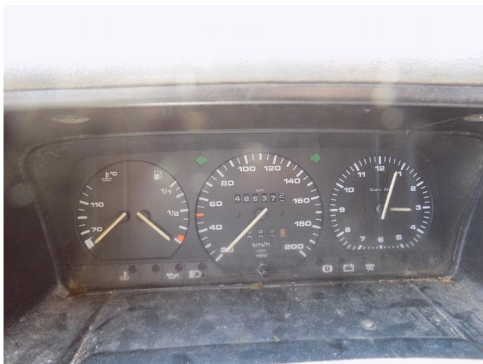
1. Volkswagen Transporter - kilometar sat

Franje Kuhača 8, 43000 Bjelovar, tel: 043/246-999, mob: 098/449-984, mail: kresimir.antulov@gmail.com